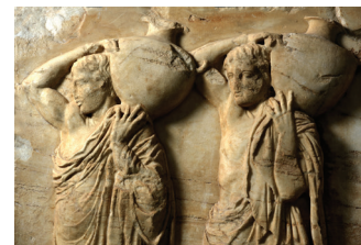
Détail de la frise des Panathénées, Acropole d'Athènes.