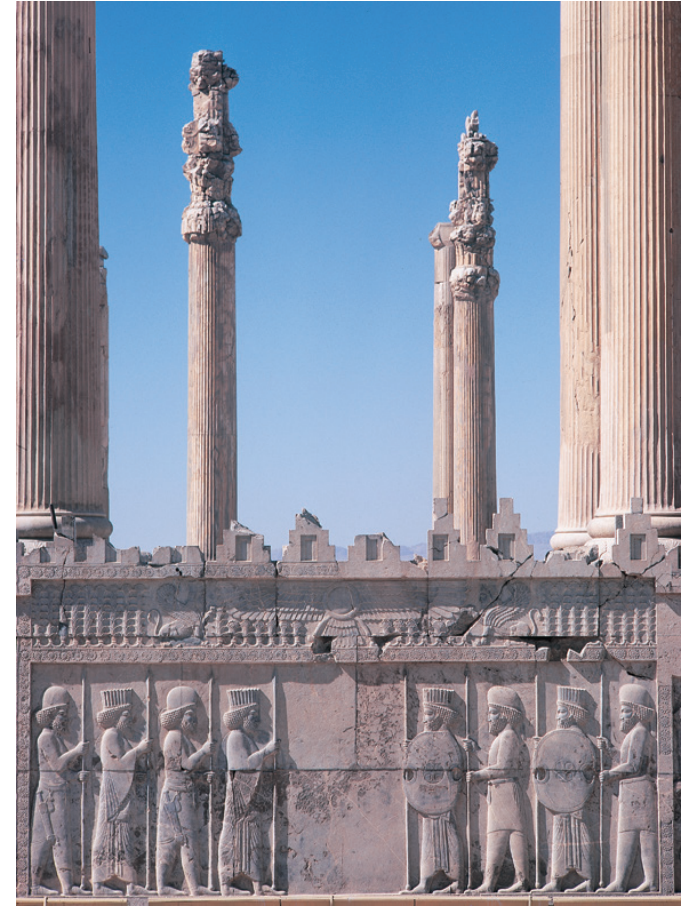
Carré central de l'apadana, Persépolis.