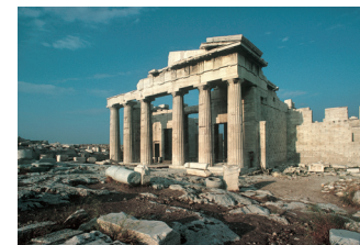
Propylées, Acropole d'Athènes.