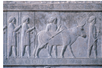
Détail de la frise des Tributaires.