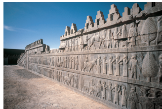
Frise des Tributaires, Persépolis.

Conclusion Postface par Manolis Korrès Le rôle d'un musée Glossaire Tableau chronologique Carte de l'Orient Bibliographie Index