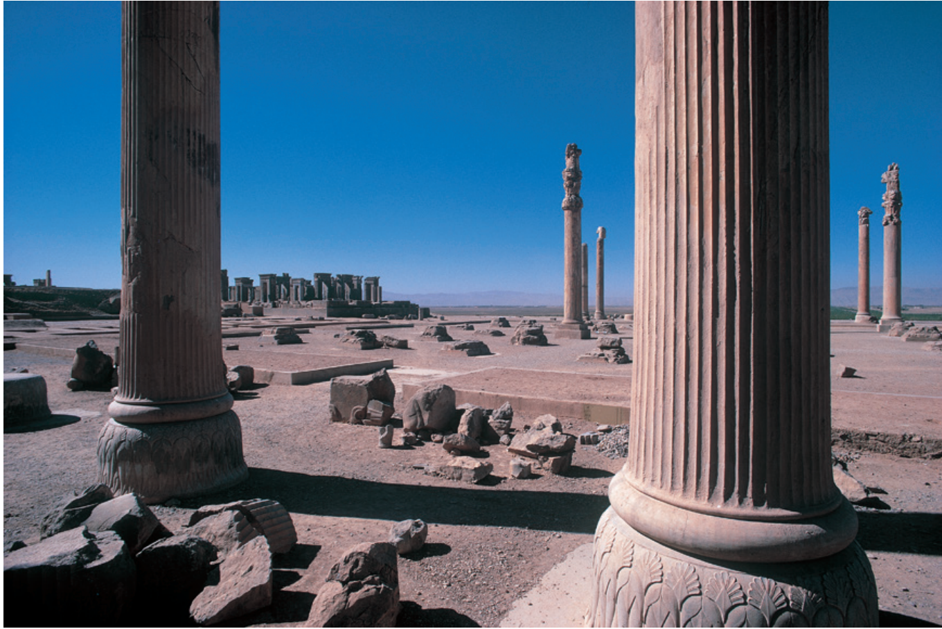
Vue générale de l'esplanade, Persépolis.